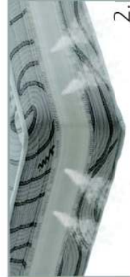
1. Box perimetrale di rinforzo con Molle Bonnell HD 136/mq. 2. Fascia perimetrale a contrasto con inserto 3D.