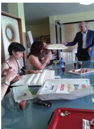
Lo showroom Simam , dove sono esposti i migliori prodotti per adulto e per infanzia, oggi sempre più utilizzato per momenti di formazione e incontro con i rivenditori .

persone che lavorano nella mia azienda, dipendenti e collaboratori, con cui mi piace stabilire rapporti di fiducia e, pensando ai giovani, provando a offrire loro un percorso di crescita professionale”.