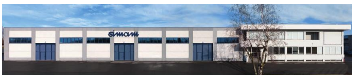
La sede dell'azienda, a Bellusco dal 1967, ampliata e rinnovata periodicamente , vede oggi i più evoluti impianti di produzione per il sistema notte

Per me che, da sempre, sono stato coinvolto nelle attività dell'azienda di famiglia, è davvero interessante ripercorrere la storia Simam, anche se la visione imprenditoriale richiede una